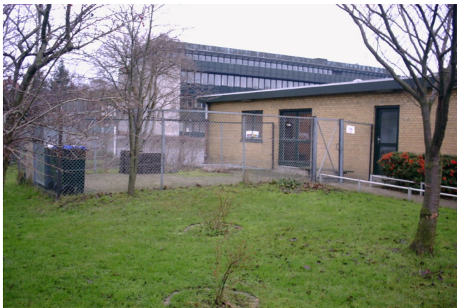
Miljøstationen ved vaskeribygningen

Affaldet skal være forsvarligt emballeret