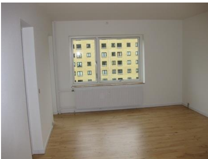
Figur 1 Stue