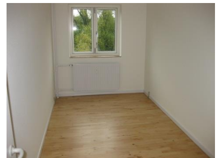
Figur 3 Lille værelse