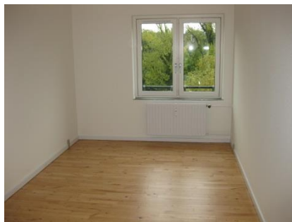
Figur 2 Stort værelse