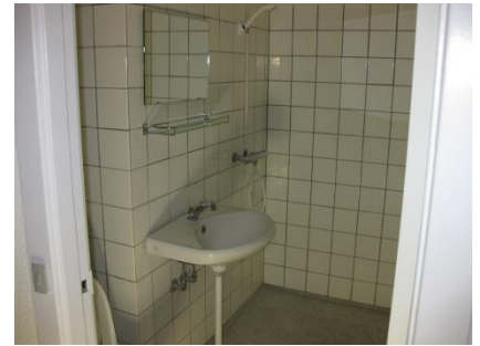
Figur 7 Badeværelse