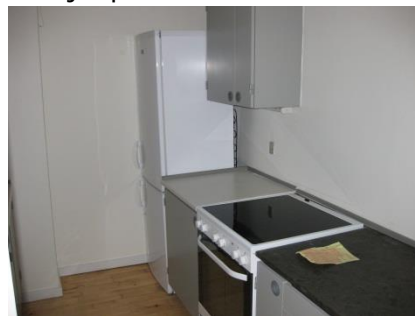
Figur 6 Køkkenelement - komfur og køle-/fryseskab