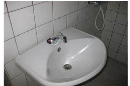
Figur 8 Håndvask