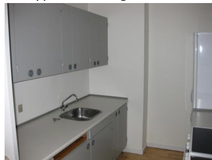
Figur 5 Køkkenelement med vask